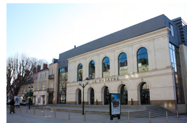
Théâtre de Laval